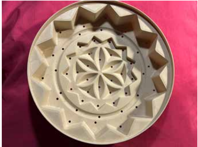
En traditionell äggostform.

Det var ett sätt att bevara mjölken, ost och smör var andra alternativ, när man inte hade tillgång till kyl. Om man slår den stelnade mjölken i en silduk och