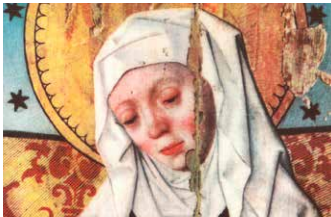
Den Heliga Birgitta på ett altarskåp i Salems kyrka.

För en tid sedan fick jag möjlighet att följa med RPG, Riksförbundet Pensionärs Gemenskap, på en utflykt till den Heliga Birgittas barndomsbygd Skederids socken. Det är något osäkert var och när Birgitta föddes, men dödsdagen är bekräftad till 23 juli 1373.