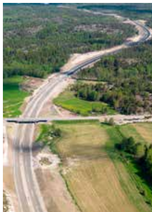
Väg E 6 skär rakt igenom Bohuslän, bland annat över den 10 000 år gamla boplatsen.

Bland fynden har man funnit flera eldhärdar och det är kolrester i härden som genom kol 14-datering har kunnat fastställa åldern till cirka 8 500 f. Kr.