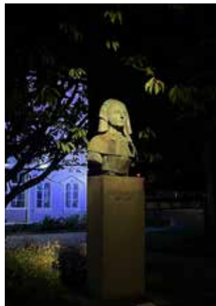
Emilie Flygare-Carlén skrev om det dansk-svenska kriget i sin bok "Skuggspel".

Natten till den 27 april rodde norrmännen från Hvaler och klockan 04:00 var de på kanonskotts avstånd från Strömstad med 16 kanonslupar och 11 kanonjullar. Den svenska flottan väntade i sundet mellan Furholmen och Killingholmen. De anfallande krävde omedelbar kapitulation, men svenskarna vägrade och skottlossning uppstod. När beskjutningen avtog drog sig båda parter tillbaka och hävdade egen framgång. På kvällen firades segern på torget i Strömstad (nuvarande Stadsparken), där man sköt salut med kanoner och serverade punsch. Om detta berättar Emilie Flygare-Carlén i sin bok "Skuggspel". Segern