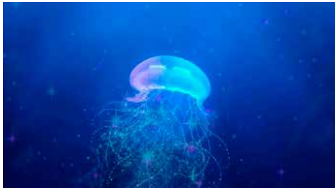
Hur parar sig maneter