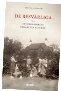
Boktipset: De Besvärliga av Louise Lindblom. Omslagsfoto Karl Josefsson-Björk

de även efter frigivningen haft kvar kontakten med Lingatans personal. Det var inte ovanligt att de besökte skyddshemmet för att visa upp sina egna barn, något som pekar på att Lingatan trots den hårda disciplinen varit en betydelsefull plats för dem.