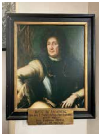
Porträtt av Rutger von Ascheberg.