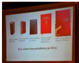
Psalmböcker genom åren.