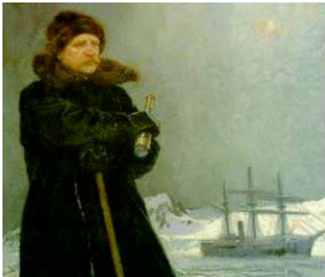
Del av målning av Georg von Rosen (1843–1923) föreställande Upptäcktsresande Nordenskiöld.

Åren 1878–1879 genomfördes Vega-expeditionen under ledning av polarforskaren Adolf Erik Nordenskiöld. Det primära syftet var att finna en genväg mellan Asien och Europa men också att utföra vetenskapliga undersökningar. I staben ingick därför två zoologer, en botaniker, en hydrograf, en lichenolog